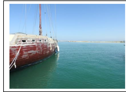
Marina im Dornröschenschlaf