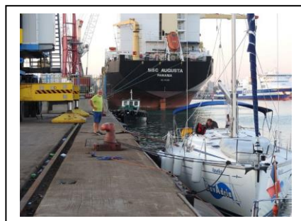
Stadthafen heißt: Frachterkai