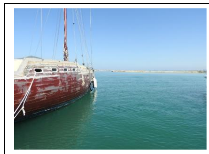
Marina im Dornröschenschlaf