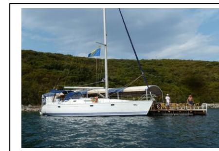
Abenteuer in Bosnien-Herzegowina

Mit der Chartersegelyacht in Dalmatien unterwegs – im Hochsommer, aber doch oft allein und an ungewöhnlichen und versteckten Orten: der neue Vortrag als Mischung aus Filmteilen, Live-Erzählungen und Kartenprojektionen ist die Fortsetzung der Vortragsserien „Einsam durch die Hochsaison“ aus 2015 und 2016. Diesmal geht es allerdings nicht mehr um unerschlossene Gebiete, sondern um Plätze, Ecken und Nischen in durchaus belebten Revieren, die aber auf irgendeine Art bis jetzt verborgen geblieben sind. Wie schon bisher gibt es weder Film noch Vortrag im Internet, sondern nur persönlich beim Clubabend, damit die Geheimtipps erhalten bleiben.