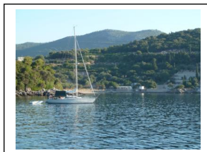
Freie Ankerplätze, ruhiger Ort