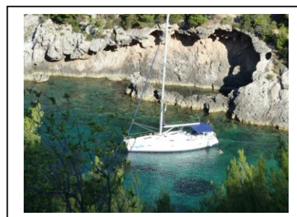
Einsame Buchten ohne Boote