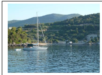
Freie Ankerplätze, ruhiger Ort