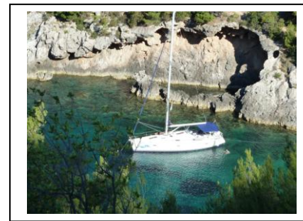
Einsame Buchten ohne Boote