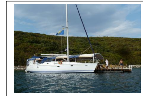
Abenteuer in Bosnien-Herzegowina

Mit der Chartersegelyacht in Dalmatien unterwegs – im Hochsommer, aber doch oft allein und an ungewöhnlichen und versteckten Orten: der neue Vortrag als Mischung aus Filmteilen, Live-Erzählungen und Kartenprojektionen ist die Fortsetzung der Vortragsserien „Einsam durch die Hochsaison“ aus 2015 und 2016. Diesmal geht es allerdings nicht mehr um unerschlossene Gebiete, sondern um Plätze, Ecken und Nischen in durchaus belebten Revieren, die aber auf irgendeine Art bis jetzt verborgen geblieben sind. Wie schon bisher gibt es weder Film noch Vortrag im Internet, sondern nur persönlich beim Clubabend, damit die Geheimtipps erhalten bleiben.